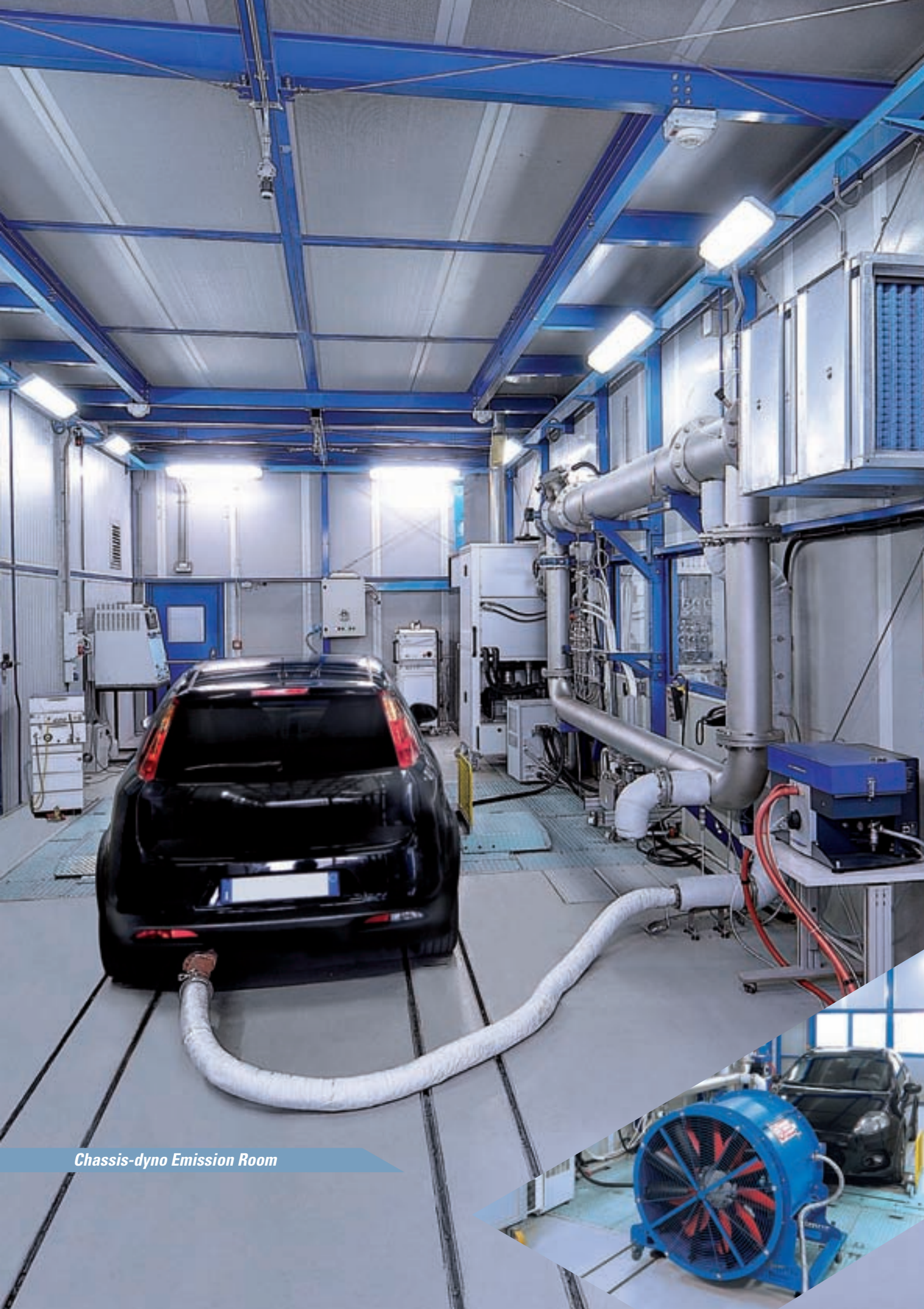
Chassis-dyno Emission Room