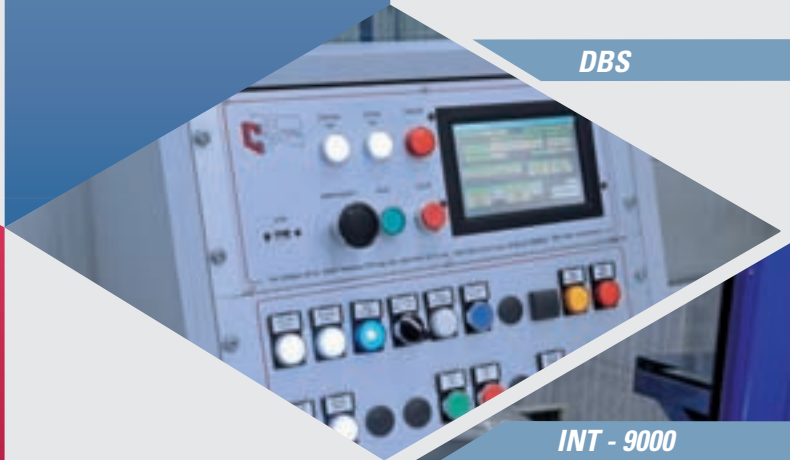
INT - 9000